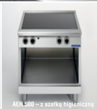
AEH 500 – z szafką higieniczną