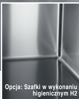
Opcja: Szafka w wykonaniu higienicznym H2