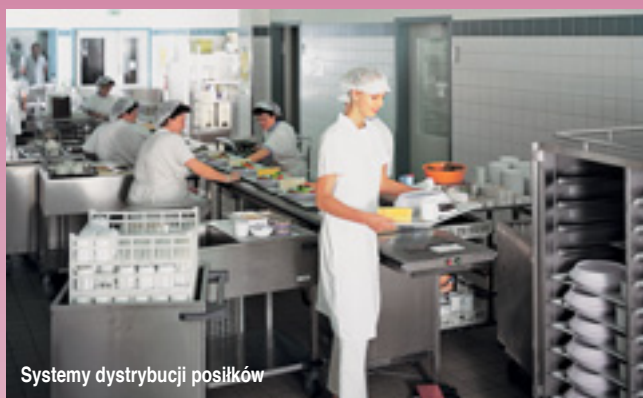
Systemy dystrybucji posiłków