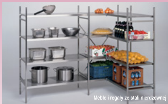
Meble i regały ze stali nierdzewnej